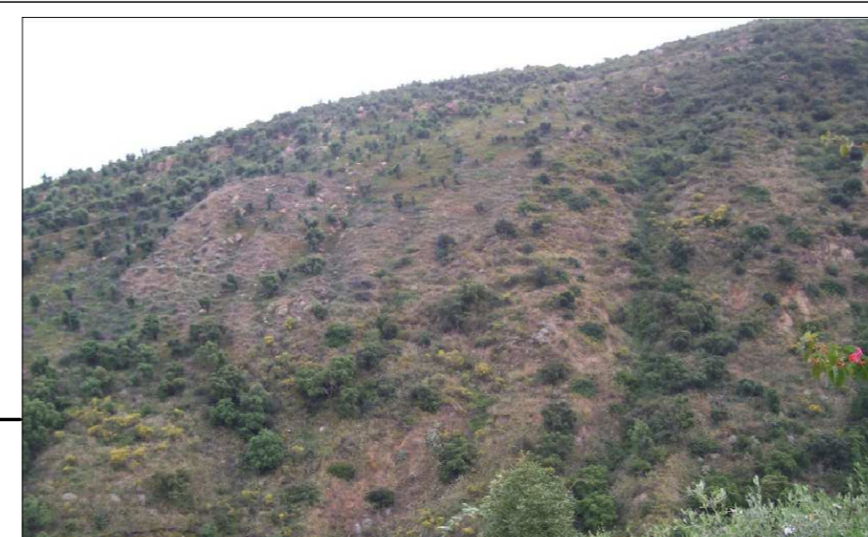
1 Vista del bosco "Bruccoli" danneggiato da un incendio